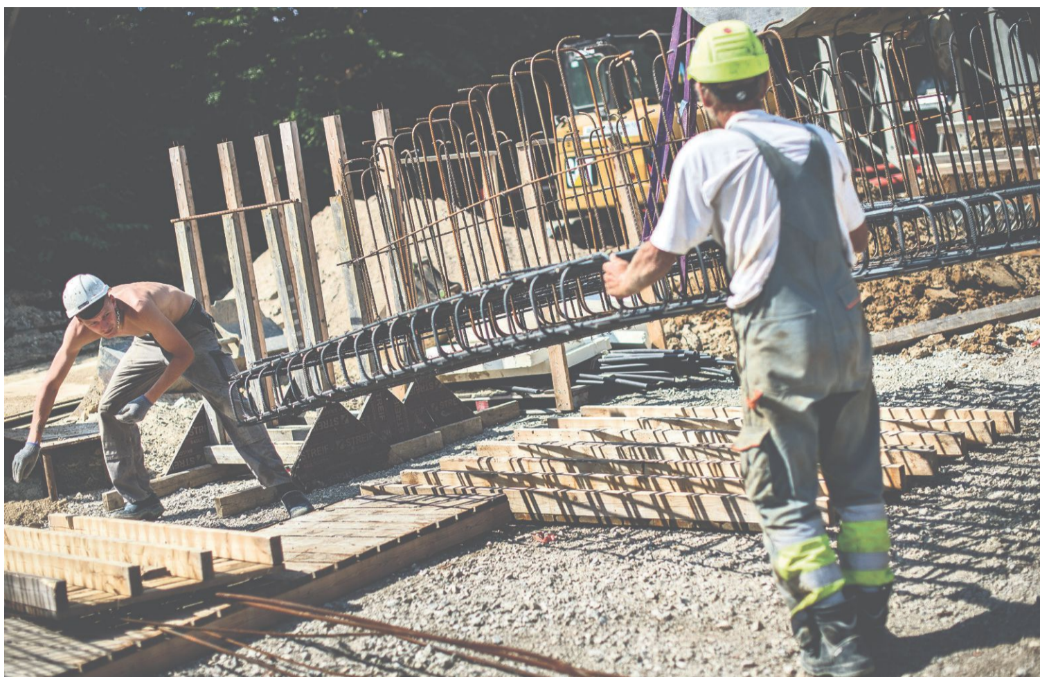
Der er fuld damp under kedlerne på byggepladserne rundt omkring, og efterspørgslen efter arbejdskraft er i top. Men kan byggebranchen organisere sig mere effektivt?

Vi er allerede godt på vej til at sikre en bedre velfærd med bedre ledelse. Og - i modsætning til de seneste mange års styringsoptimisme - er vi desuden godt hjulpet af den danske arbejdskultur med lav magtdistance og høj gensidig tillid. Men forudsætningen for at vi kommer helt i mål er dog, at vi tager den ledelsesmæssige udfordring op og tør organisere, lede og kompetenceudvikle os til den nye virkelighed. Forhåbentlig vil Ledelseskommisionens arbejde være et skridt i den rigtige retning. Men det må ikke blive ved de gode intentioner. Det kræver også ledere, der tør udvikle sig.